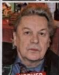
HELMUT BERGER, 71, gönnte sich 2013 Facelift und Lidstraffung. Er sieht wacher aus. Stirn, Wangen und Halspartie sind definierter