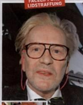
FACELIFT UND LIDSTRAFFUNG